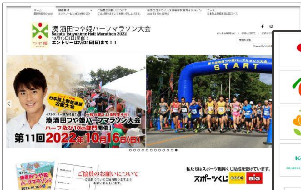
※第11回大会ホームページより抜粋